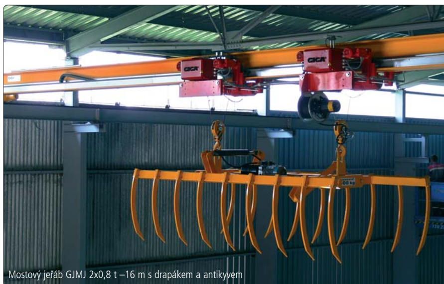
Mostový jeřáb GJMJ 2x0,8 t –16 m s drapákem a antikvyem

Na západ od našich hranic je poměrně velká konkurence, naší doménou je Česko, Slovensko a Východní Evropa. Nicméně jsme zajímavými partnery v oblasti manipulační a jeřábové techniky pro české, ale i zahraniční firmy v Česku působící. Jsme firmou, která má 24hodinový servis se zárukou rychlého dojezdu a odstranění problému. Firma, která jeřáby vyrábí, odstraní problém snadněji a rychleji než jenom obchodní zastoupení zahraničního dodavatele.