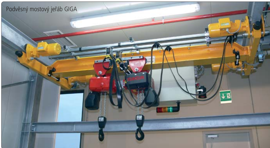
Podvěsný mostový jeřáb GIGA