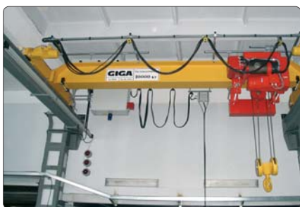
Mostový jeřáb GJM 10 t – 5,1 m, Okulovka – Rusko

i současnost ukazují, že společnost GIGA, spol. s r.o. je kvalitním partnerem na českém trhu zdvihacích zařízení se silným vlastním zázemím techniků a špičkového dílenského zpracování produktů.