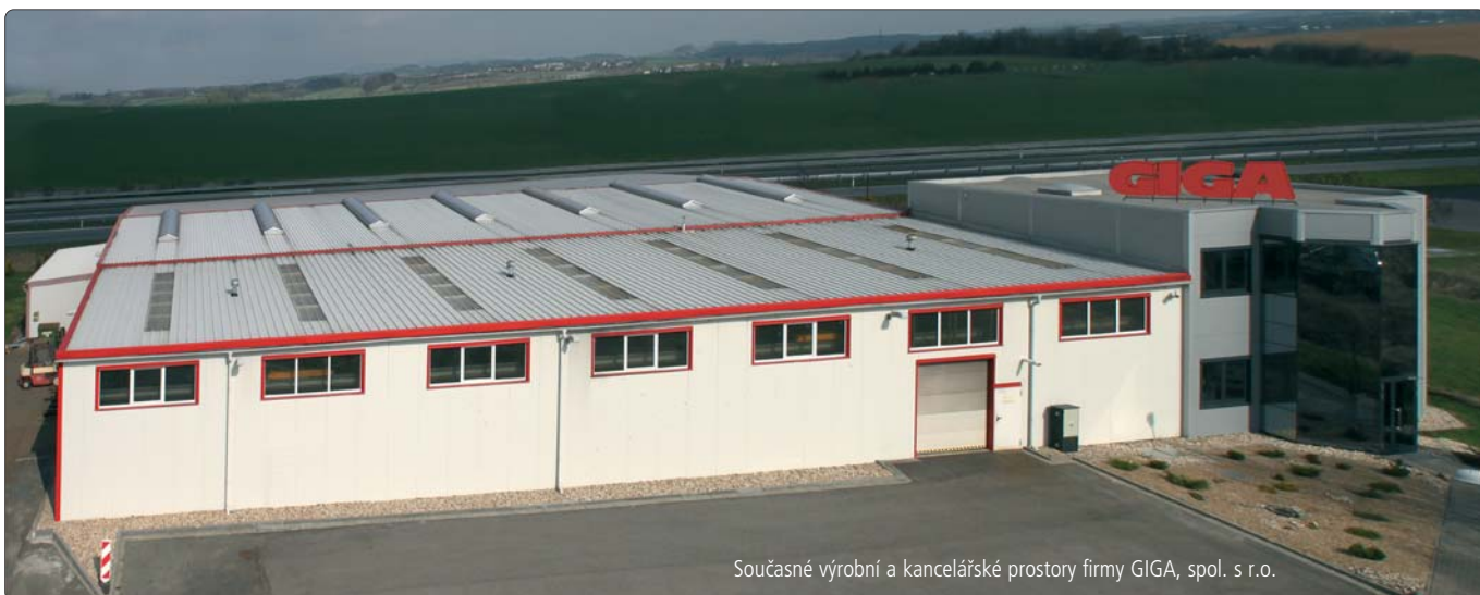
Současné výrobní a kancelářské prostory firmy GIGA, spol. s r.o.

Samotnému rozhodnutí předcházela průzkum trhu, ze kterého vyplynulo, že na českém trhu bylo dostatek volného prostoru pro výrobce zdvihacích zařízení. Začátky byly opatrné, v pronajatých prostorách jsem nejprve sám, posléze s narůstajícím počtem spolupracovníků produkoval v kusových sériích kladkostroje, posléze i jeřáby a další komponenty jeřábové techniky. Dnešní podoba společnosti GIGA je zcela