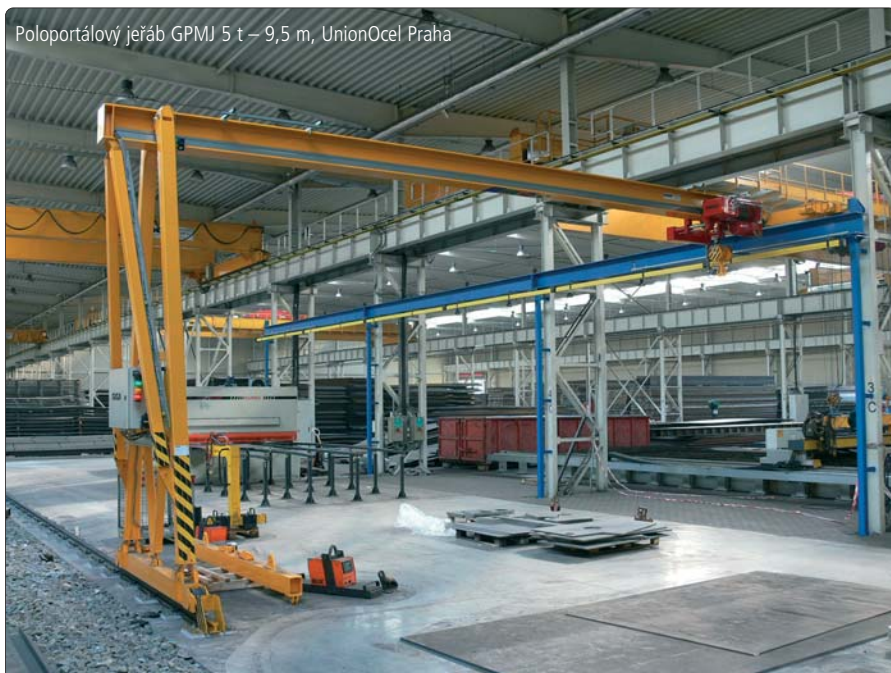
Poloportálový jeřáb GPMJ 5 t – 9,5 m, UnionOcel Praha

Mám vzdělání technického směru a technika, to je obor, který mě baví téměř od dětských let. Po ukončení studií jsem nastoupil do zaměstnání na pozici konstruktéra a později jsem měl i další funkci revizního technika zdvihacích zařízení. V devadesátých letech minulého století byly v Česku k dostání zejména kladkostroje značky Balkankar, které nahradily